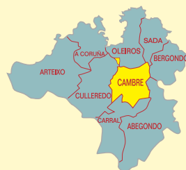
“terra das mariñas”

antigas corredoiras, pola misteriosa Pena da Nosa Señora con gravados e inscricións perdidos no tempo e por algunhas das últimas fragas do concello.